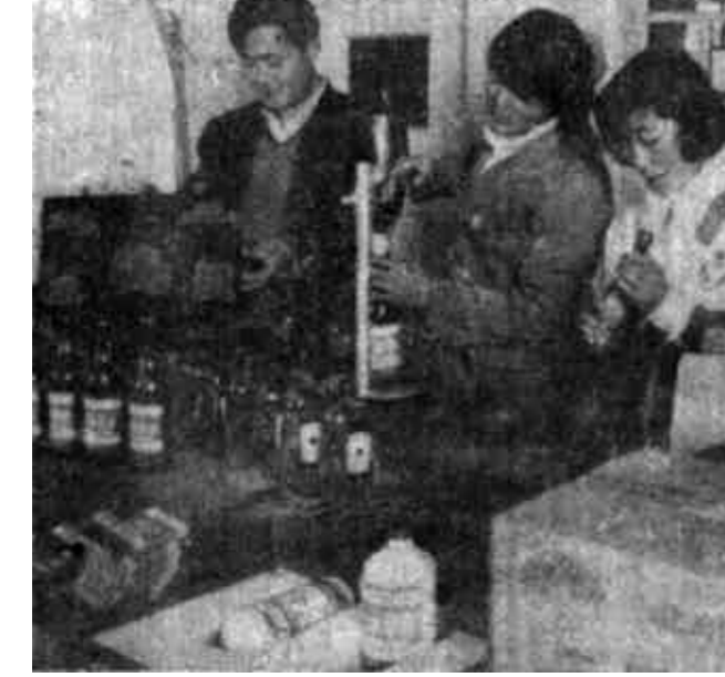
▲广饶县陈官乡与北京黄尚酒厂联合办起了一家“太白醉”酒厂。该乡提供厂房、人员,京方提供技术和原料,生产北京名牌二锅头酒。该酒厂日生产能力4吨,投产

河口讯 今年以来,河口区又有300多户农民打开了临街房屋的墙壁,门朝大路,分别搞起了小商品经销、车辆维修和饮食、娱乐服务等业务。